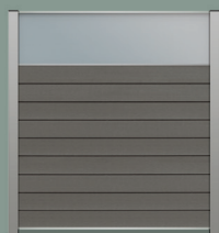
45 cm opaal glas