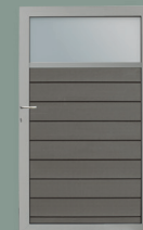
Tuinpoort + glas