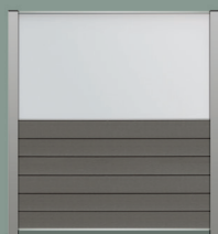
90 cm helder glas